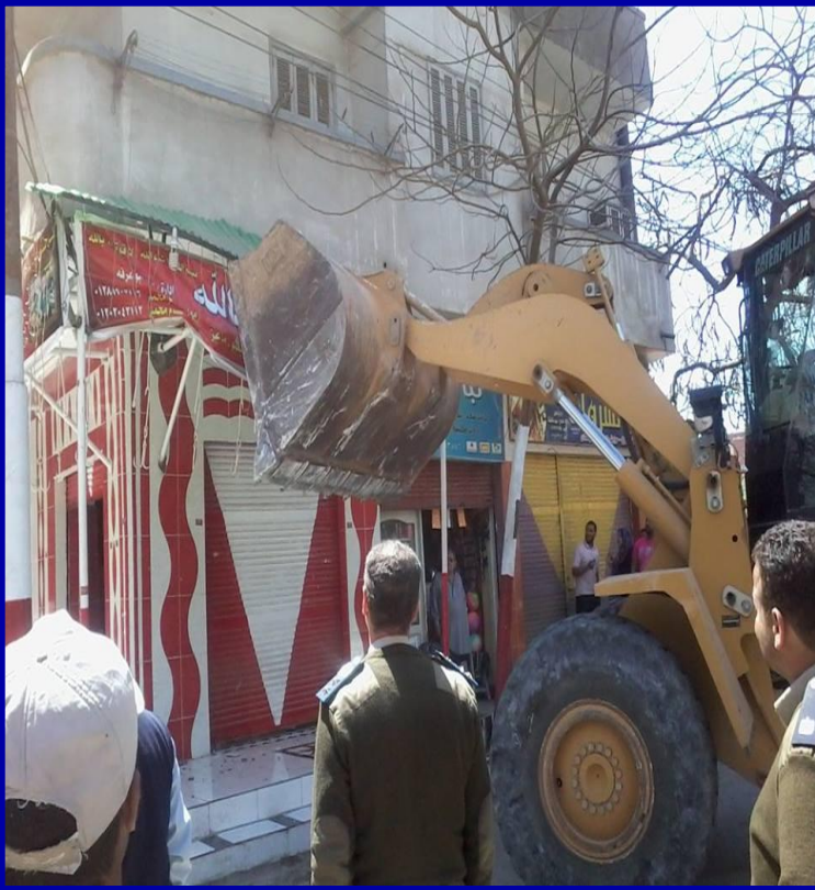
صورة توضح للودر التابع للوحدة المحلية وهو يقوم بإزالة اليفظ من على المحلات المخالفة والتي بدون تراخيص بمنطقة حوض الدلالة ( بمحى الدين ) .