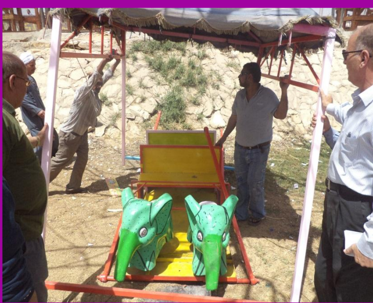
السيد العميد / وهو يقوم بمساعدة الحملة لرفع الإشغالات ،، والمخلفات صورة توضح مدى إهتمامه بنظافة المدينة وبت روح العمل للعاملين الموجودين بالصورة .