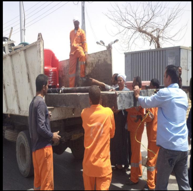
صورة توضح تنظيف الشوارع من المخلفات بعد إزالتها وتحميلها في السيارة التابعة للوحدة المحلية لمركز ومدينة بنى سويف عن طريق جهود العاملين بالوحدة بالوحدة .