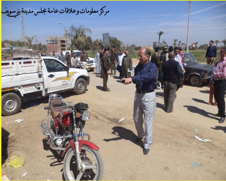
مركز معلومات وعلاقات عامة مجلس مدينة بنى سويف

صورة موضحة للودر التابع للوحدة المحلية لمركز ومدينة بنى سويف وأثناء هدم المباني المخالفة والمتعدية على أملاك الدولة .