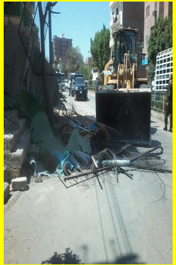
صورة موضحة للحملة المكلفة ، وهي تقوم برفع الاشغالات ، ، ونظافة الشوارع من المخلفات بعد إزالتها من تلك المناطق المذكورة .

قامت حملة مكبرة بمنطقتى / محى الدين ، ، الاباصيرى بشارع / عبد السلام عارف لإزالة جميع الاشغالات والمخلفات ، ، والمحلات المخالفة قانونيا ، ، وبدون تراخيص والموجودة بتلك المناطق ، ، وتوفير أماكن أخرى للباة الجائلين الموجودين بمنطقة محى الدين (حوض الدلالة) بدلا من إشغالهم للطرق العامة وكانت الحملة يوم ٢٠١٥/٣/٣١ .