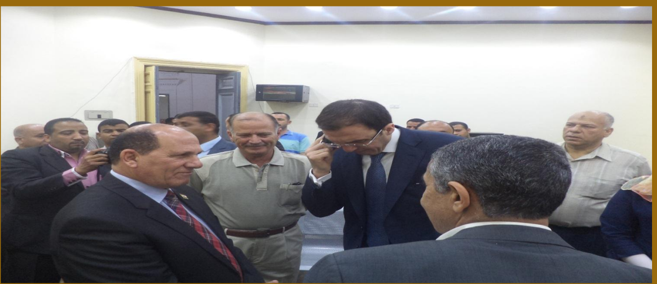
السيد المستشار محمد سليم / أثناء قيامة ومتابعة شخصا بالاتصال هاتفيا مع أحد المستثمرين من المشروع القومي للتنمية المجتمعية والبشرية والمحلية ، صورة توضح مدى اهتمام سليم بتشجيع الشباب بالتوجه الى المشروعات الصغيرة ومتناهية الصغر للتطلع نحو مستقبل أفضل يصنعونه بأيديهم .