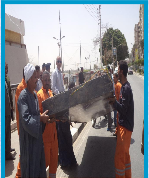
السيد العميد / مع العاملين بالوحدة المحلية وأثناء قيامهم برفع تلك المخلفات بعد إزالتها .