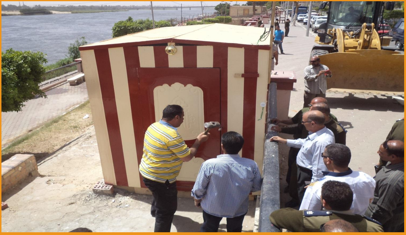
متابعة السيد العميد / إزالة أحد الاكشاك المخالفة بكورنيش النيل بعد إعطاء أوامر للحملة المكلفة برفع الإشغالات بالمنطقة .