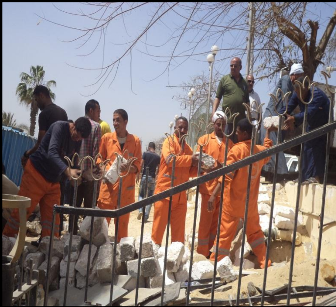
صورة موضحة للعاملين أثناء قيامهم برفع المخلفات بعد إزالتها .