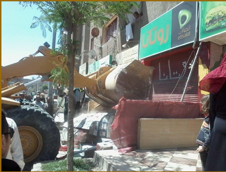
صورة للودر التابع للوحدة المحلية وهو يقوم بإزالة ، ورفع الاشغالات التي توجد أمام المحلات بمنطقة الاباصيرى بشارع عبد السلام عارف .