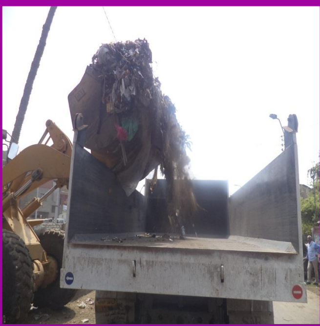
صورة (٢) لرفع القمامة بعد إزالتها وتحميلها في السيارة التابعة للوحدة المحلية لمركز ومدينة بنى سويف .