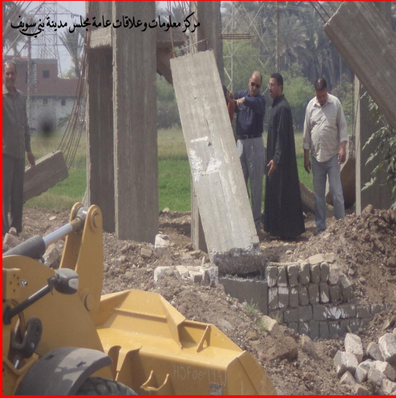
مركز معلومات وعلاقات عامة مجلس مدينة بنى سويف

قام السيد العميد / أحمد عبد الرحمن عيطة رئيس مركز ومدينة بنى سويف . بعمل حملة مكبرة بقرية الكوم الاحمر التابعة للوحدة المحلية لمركز ومدينة بنى سويف . وقامت الحملة بإزالة المباني المتعدية والمخالفة على أملاك الدولة بالقرية . وكان ذلك يوم ٢ / ٤ / ٢٠١٥ .