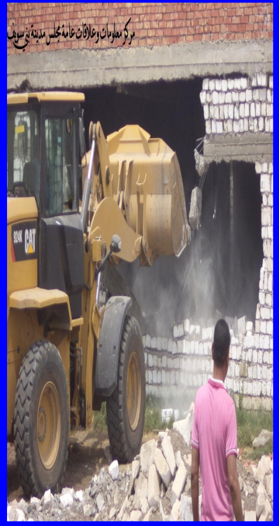
مركز معلومات وعلاقات عامة مجلس مدينة بنى سويف

صورة للسيد العميد / وهو يباشر أعمال الازالة للبيوت المتعدية على الاراضى التابعة لأملاك الدولة بقرية الكوم الاحمر بمركز بنى سويف .