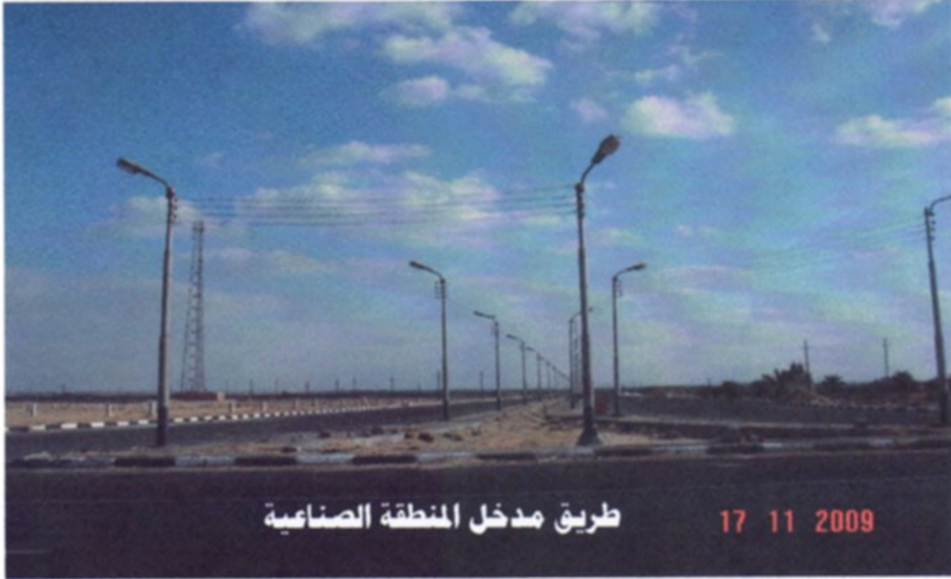
طريق مدخل المنطقة الصناعية