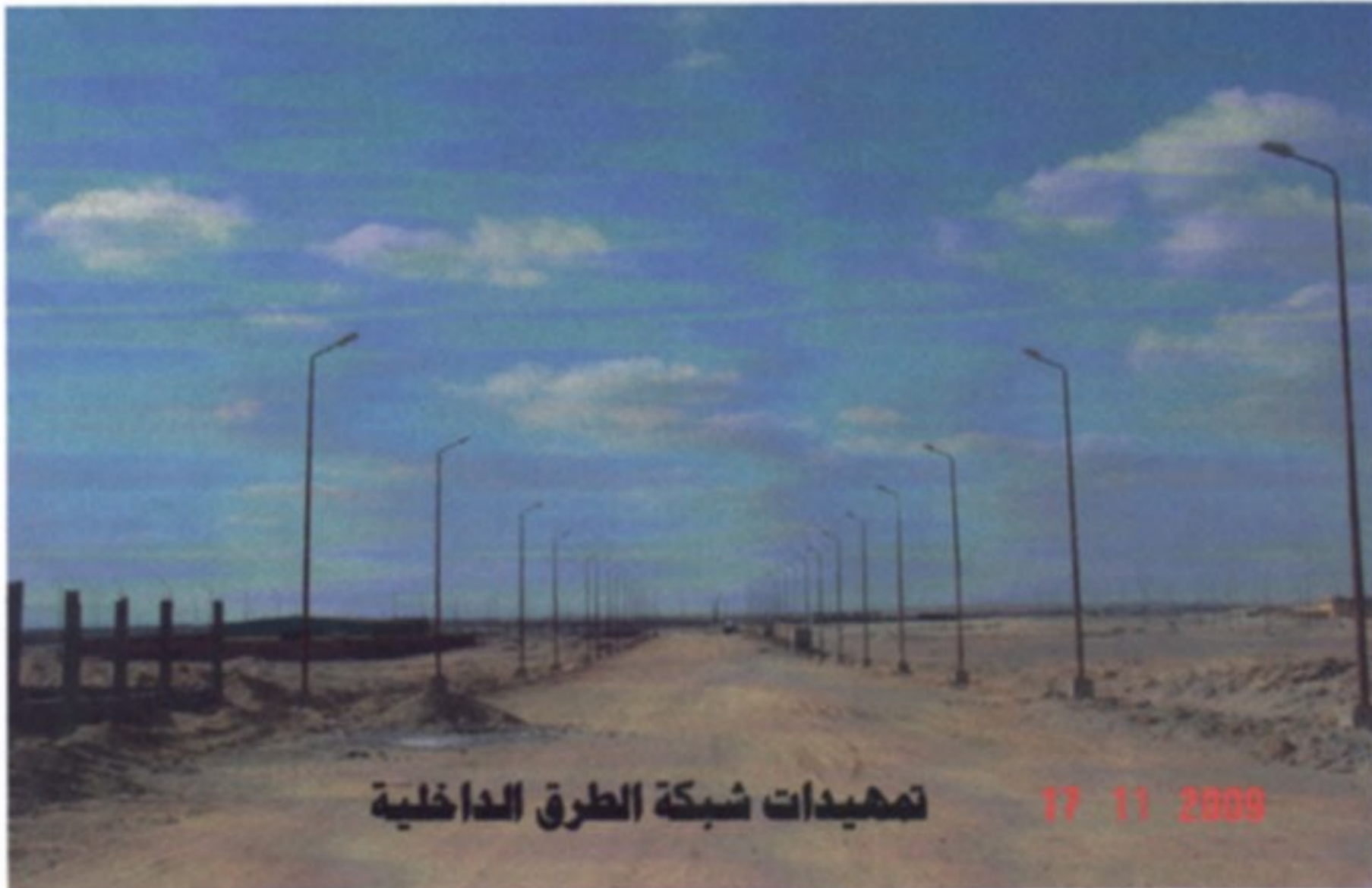
تمهيدات شبكة الطرق الداخلية